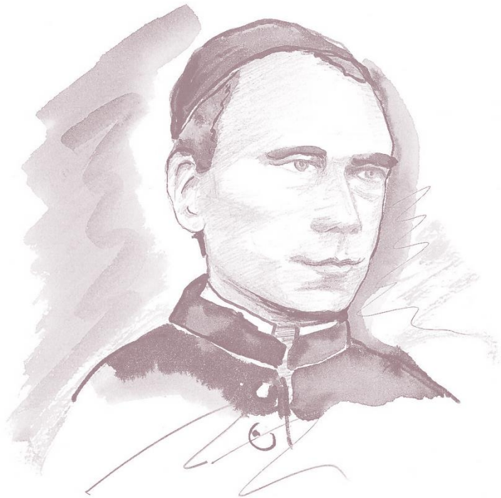
Adolph Kolping 1813-1865